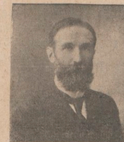
M. Henri Rabaud