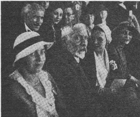
GABRIEL PIERNÉ AU CONCERT A SA GAUCHE : M mes CARINA ARI ET DEBUSSY ; DERRIÈRE LUI : A. TOSCANINI