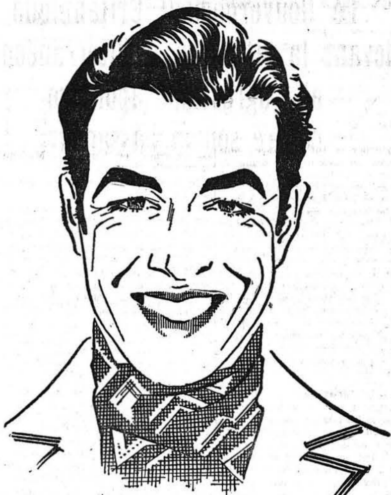
Robert Taylor, que l'on peut voir actuellement au Balzac, dans « Sa dernière chance ».

Cinq minutes plus tard, — il n'était pas dix heures du matin, — Milton, attablé à un bar du Parc des Attractions, se restaurait, en attendant que soit venu pour lui le moment de prendre place dans une des balancoires du « Star », cette attraction