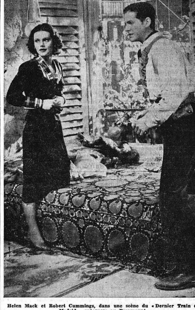
Helen Mack et Robert Cummings, dans une scène du « Dernier Train de Madrid », qui passe au Paramount.