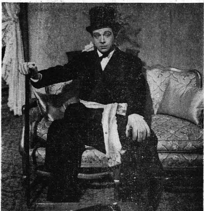
L'une des scènes qui, dans le film de Mervyn le Roy, a provoqué de si violentes réactions de la part des Anglais, fidèles au souvenir d'Edouard VIII

Le jour venu, le candidat, qui a loué son fauteuil, se rend au théâtre, le cœur battant. Au premier entr'acte, il arpente, avec anxiété, les couloirs et le foyer... Hélas ! Point de jeune fille blonde à cape d'hermine sur robe de velours noir, point de million en quête d'épouseur, mais une bonne douzaine de messieurs