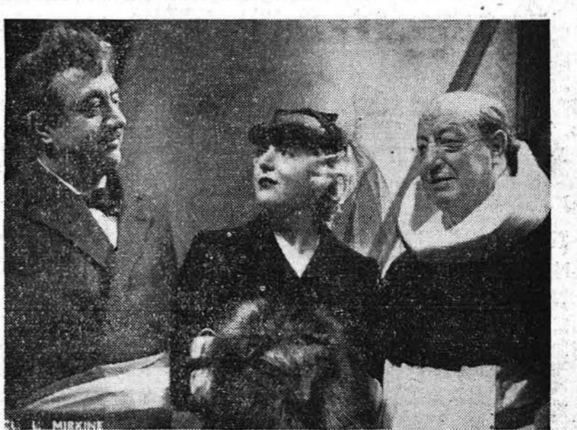
Trois grandes vedettes françaises, Raimu, Marie Bell et Harry Baur, se trouvent réunies sur cette photo, prise il y a quelques jours au studio, où Julien Duvivier tourne « Le Carnet de Bal » (Lire notre article en rubrique cinéma).