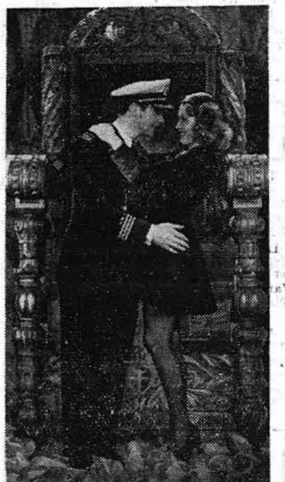
Fernand Gravey, roi déchu, et Joan Blondell, dans « Le Roi et la Figurant »