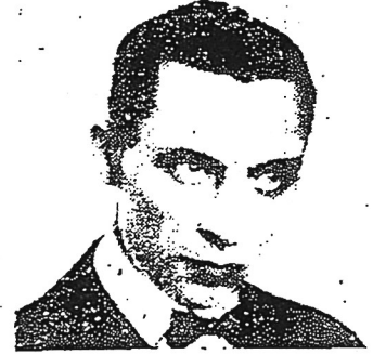
Louis JOUVET Notre collaborateur, qui vient d'être attaché au nouveau directeur de la Comédie - Française, donnera à Vienna, au Congrès de la Société universelle du Théâtre, une repré- sentation de « L'Ecole des Femmes »

très large du Zay-Rucart exa- que devient ve